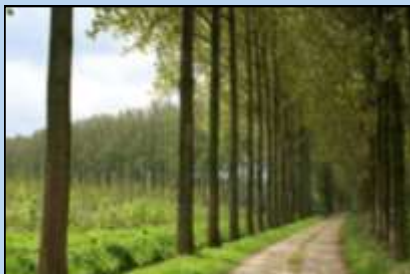
Winterserietocht vanuit Boskant op 15 november: een vooruitblik