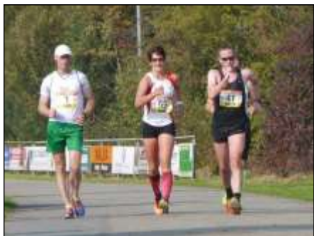
De latere winnaars van de 50 km heren, 10 km dames en 20 km heren

schuiving voor kniestrekking. Lichamelijk voel ik mij nog goed. Wel is nu merkbaar dat het tempo begint te zakken, maar ik loop nog op mijn eigen schema.