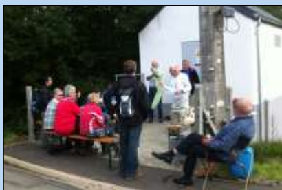
Clubreizen: verslag reis september en 'epiloog' commissie Clubreizen